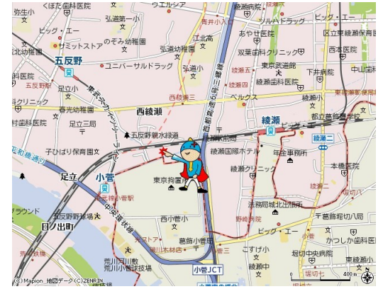
図面と現況が異なる場合は現況が優先となります。