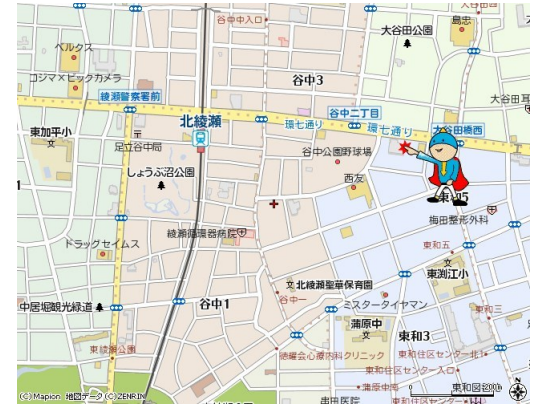
図面と現況が異なる場合は現況が優先となります。